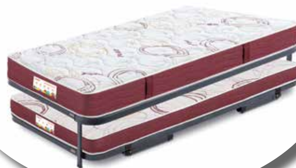
Colchones Junior + Cama Nido F2

Total colchón: 18,3 cm. Total bloque: 14 cm.